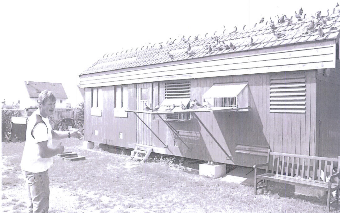
Le colombier de jardin : à gauche les veufs, à droite les jeunes.

Perpignan national en descendent. Puis il y a eu des Marc Roosens, des Carteus "plus difficiles à cultiver. En consanguinité, c'était de beaux pigeons, mais nous les perdions quasiment tous. Il a fallu les croiser avec les Fruitiier pour obtenir la réussite". La 263262-03, lauréate de Perpignan national, a d'ailleurs pour mère une Carteus.