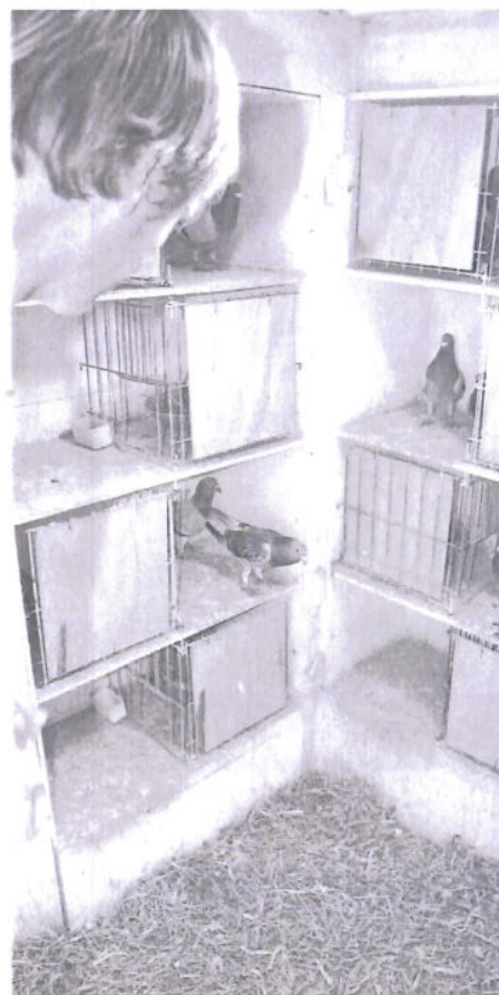
Les pigeons joués au naturel sont dans un pigeonnier de grenier. Au sol, de la paille de pois.

Retrouvez les photos couleurs sur http://colombophilie.canalblog.com/