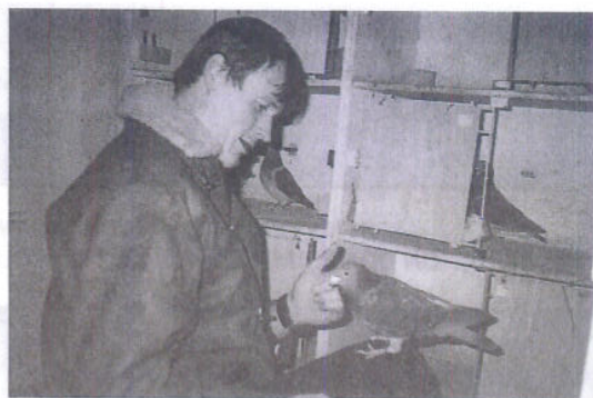
"Le Roger" 679 103 - 96

* Les 1 er et 2 ème As Pigeonneaux 99 au GSM * Le 526-97 En 99 : 33/3.144 Montauban , 2/3.054 Toulouse, 42/1.532 Perpignan * La 138-98 (Pt-Fille de la "Puce") Poitiers 11/2.190 Angoulême 7/1.665 * La 116-96 (Fille de la "Puce") Brive 7/516 St Jean de Luz 534/2.399 Toulouse 249/3.054 Perpignan 271/1.532 * Le 145-96 (Petit Fils de la "Puce") en '99 : Vierzon 25/638- St Jean de Luz 497/2.399 Montauban 235/3.144 Perpignan 5/1.532 Toulouse 93/3.054