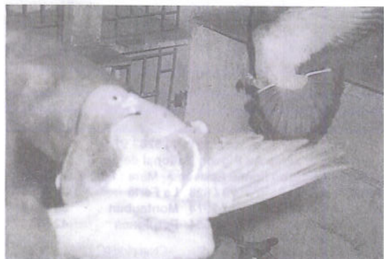
"L'As" 114 377 - 93 As Fond Fédéral 1999

* 26/6 St Jean de Luz (690km) UNION : 1, 5, 8, 10, 11, 13, 15, 21 contre 216 vx GSM : 8, 29, 33, 36, 38, 57, 63 contre 729 vx FEDERAL : 13, 60, 67, 74, 77, 113, 130, 176 ... face à 2.399 vx et 20 prix de 34 engagés * 14/7 Perpignan (748km) UNION : 1, 2, 3, 5, 7, 11, de 119 vx GSM : 2, 3, 4, 6, 10, 18, 19, 22, 28, 46... de 524 vx FEDERAL : 2, 4, 5, 7, 13, 23, 24, 27, 42, 72, 82, 96, 106, 123, 128, 132, 133... de 1.532 vx et 21/24 NATIONAL : 6, 10, 15, 24, 65 ... de 7.410 vx * 23/7 Burgos (845km) GSM : 2, 21 ... de 293 vx FEDERAL : 5, 52, 92 ... de 927 vx INTER-FEDERAL : 6, 58, 107 ... de 1.157 vx 4/12 * 24/7 Marseille (747km) NATIONAL : 28, 96 de 1.862 vx BENELUX : 70, 230 de 10309 vx