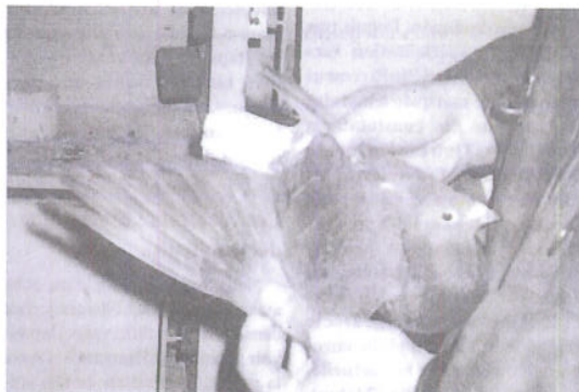
"Le Queue Blanche" 658 353 - 97

Les femelles quant à elles, seront préparées dans l'optique des concours de fond. De ce fait, lors des plus belles étapes du mois de juillet, certaines d'entre elles seront alors capables de se surpasser, puisque leur motivation n'aura pas encore été émoussée, contrairement aux veufs. L'AS femelle Fédéral de fond 99, la 679168/96, a pu remporter notamment 4 prix, rien qu'au naturel. Des oeufs frais aux petits jeunes, en passant par un couvage de 10 jours, cette femelle s'est toujours bien présentée pour une première saison de fond Montauban 520/3.144