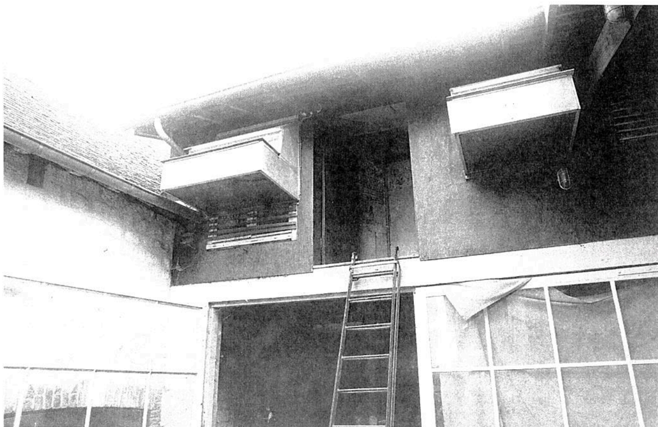
Le colombier du Perpignan.