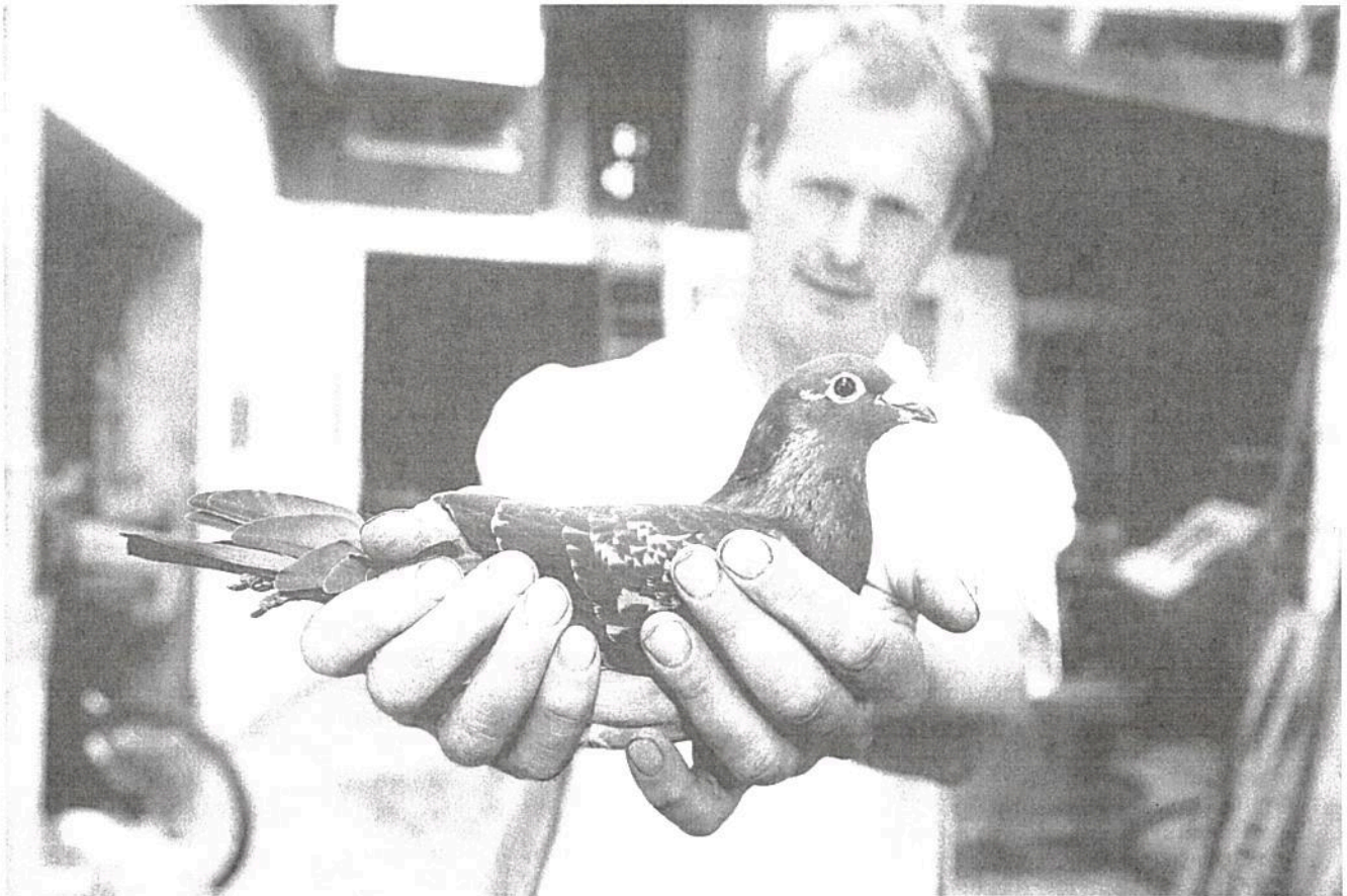
La Catalane, 1 er national femelles Perpignan 2013.

sur Perpignan 2013 : cette année, elle est primée à Bayonne et Narbonne, avant de clôturer sa saison sur Perpignan à 20h18.